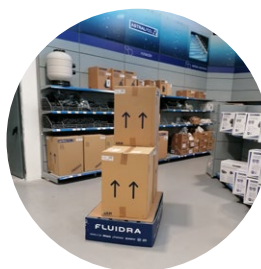
Calidad y servicio profesional.