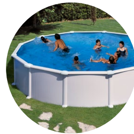
Versatilidad: para instalación en piscinas elevadas o enterradas.